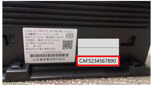
お客さまIDが記載されています。