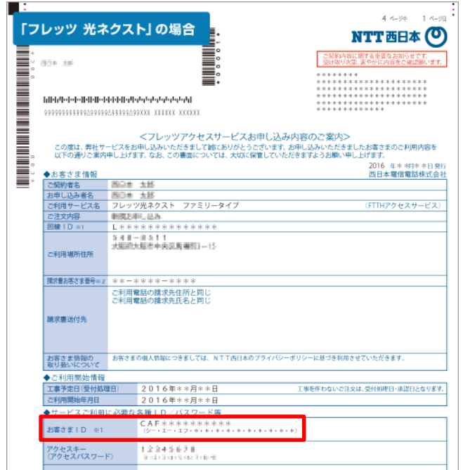
「お申し込み内容のご案内」のイメージ

※参考URL： https://fleets-w.com/user/about_id/