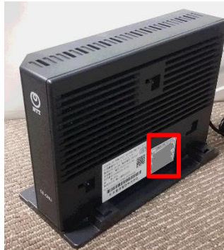
側面に貼付されている シール